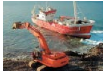
Vinnuvélar voru fluttar af Kleifaheiði.