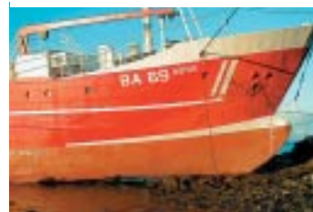
Það var mikil vinna að þetta Núp.